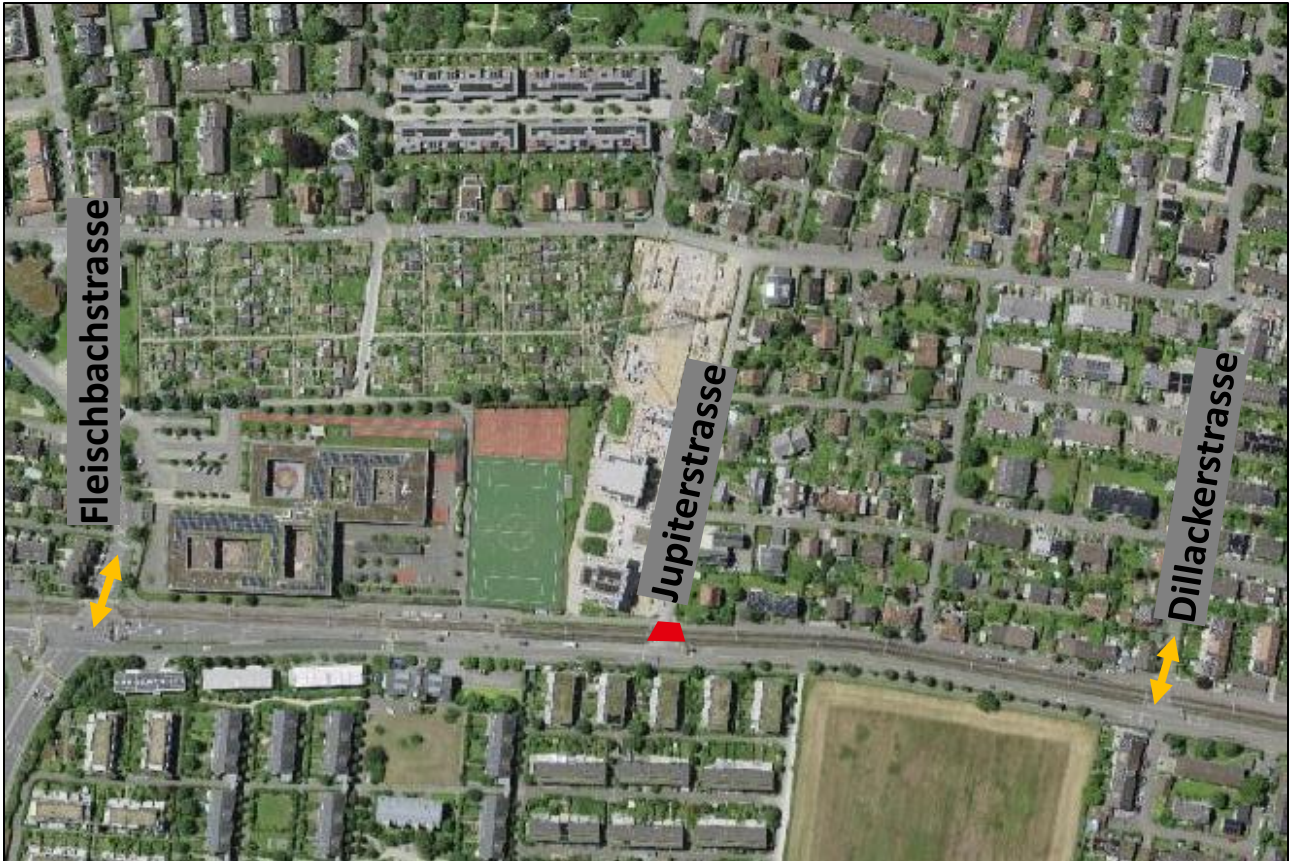
Skizze 1: Bauperimeter